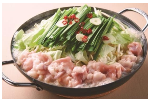
もつ鍋 とんこつ味