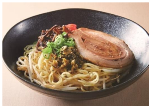
焼きラーメン とんこつ味